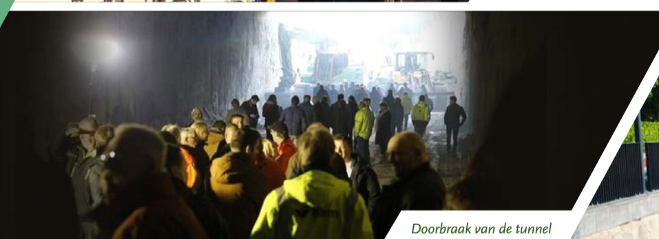
Doorbraak van de tunnel