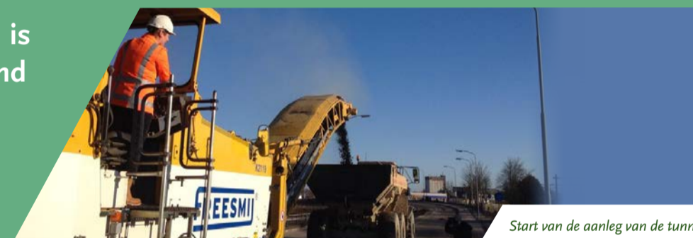
Start van de aanleg van de tunnel

Na maanden van wegwerkzaamheden en omleidingen is het dan echt zover: op zaterdag 9 juni gaan aan het eind van de dag de Overcingeltunnel en de Stadsboulevard open voor het verkeer. Van het werk zijn vele foto's gemaakt. Op deze pagina een impressie. Ook ziet u op de kaart waar u vanaf 9 juni langs kunt rijden met de fiets en de auto. En we nodigen u uit om voor de opening nog even een kijkje te komen nemen in de tunnel op zaterdag 9 juni tussen 14.00 en 16.00 uur. U bent van harte welkom!