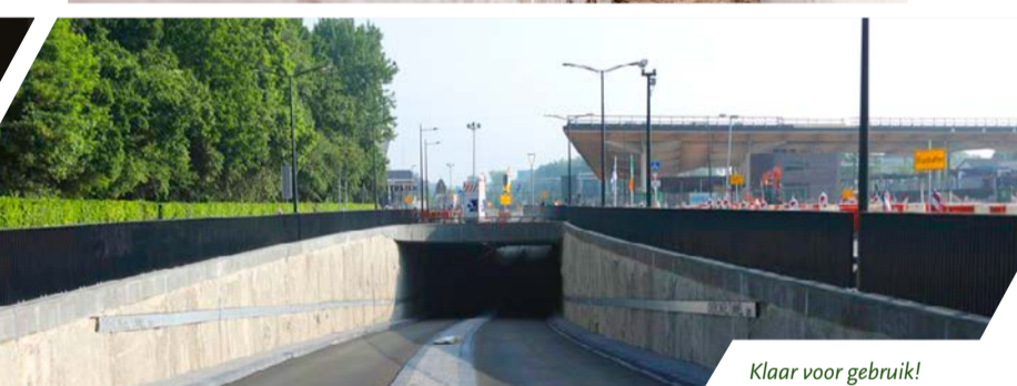
Klaar voor gebruik!